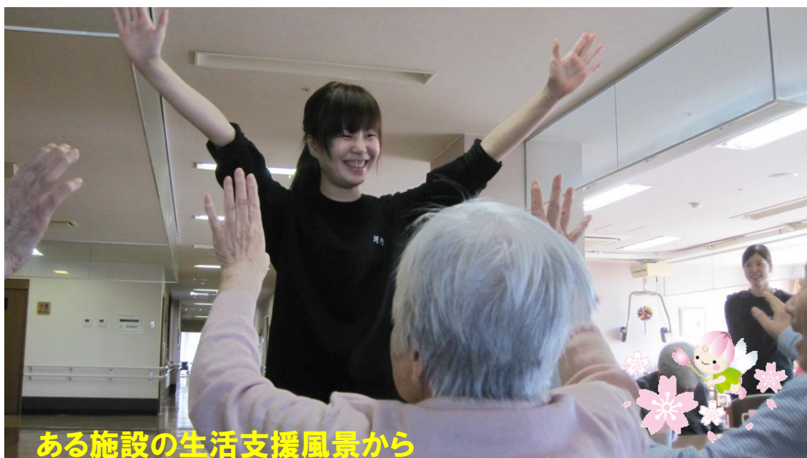
ある施設の生活支援風景から

講師陣には経験豊かな人材を揃え、より良い教育を安価な費用で皆さんの挑戦を応援します。